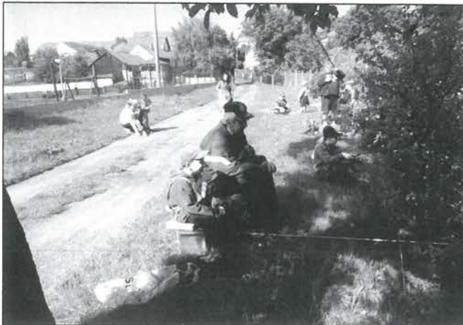
Fotografie viz také na další straně.

společnosti LUKREAL, s.r.o. kde se zájemci mohli seznámit se základy řezbářství. Kulturní léto bylo zakončeno druhou vernisáží, tentokrát fotografiemi pana Z. Šiplera.